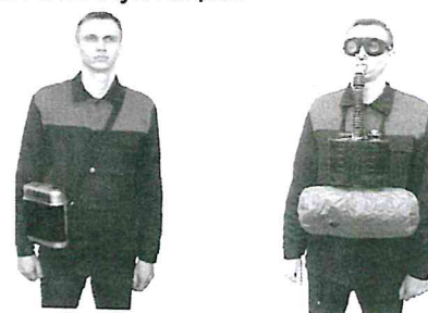
а) плечевое ношение